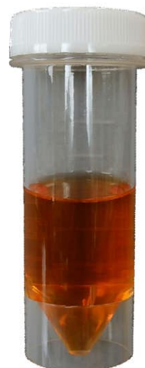
現:ポストサンプラー (松浪硝子工業製)