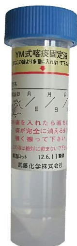
新:YM式喀痰固定液 (武蔵化学製)